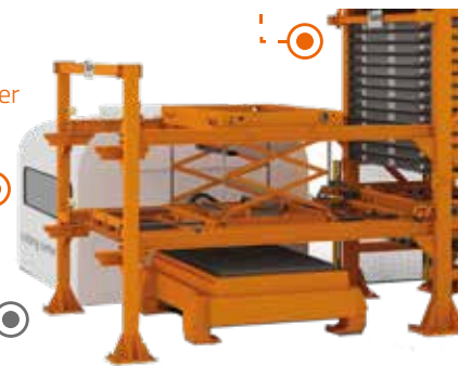
Logi TowerLoader AUTOMATA RAKODÓGÉP LOGITOWER LOADER