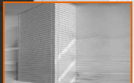
ÉPÜLETEN KÍVÜLI TELEPÍTÉS