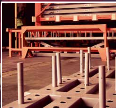
RAKLAP ELTÁVOLÍTÓ RENDSZER