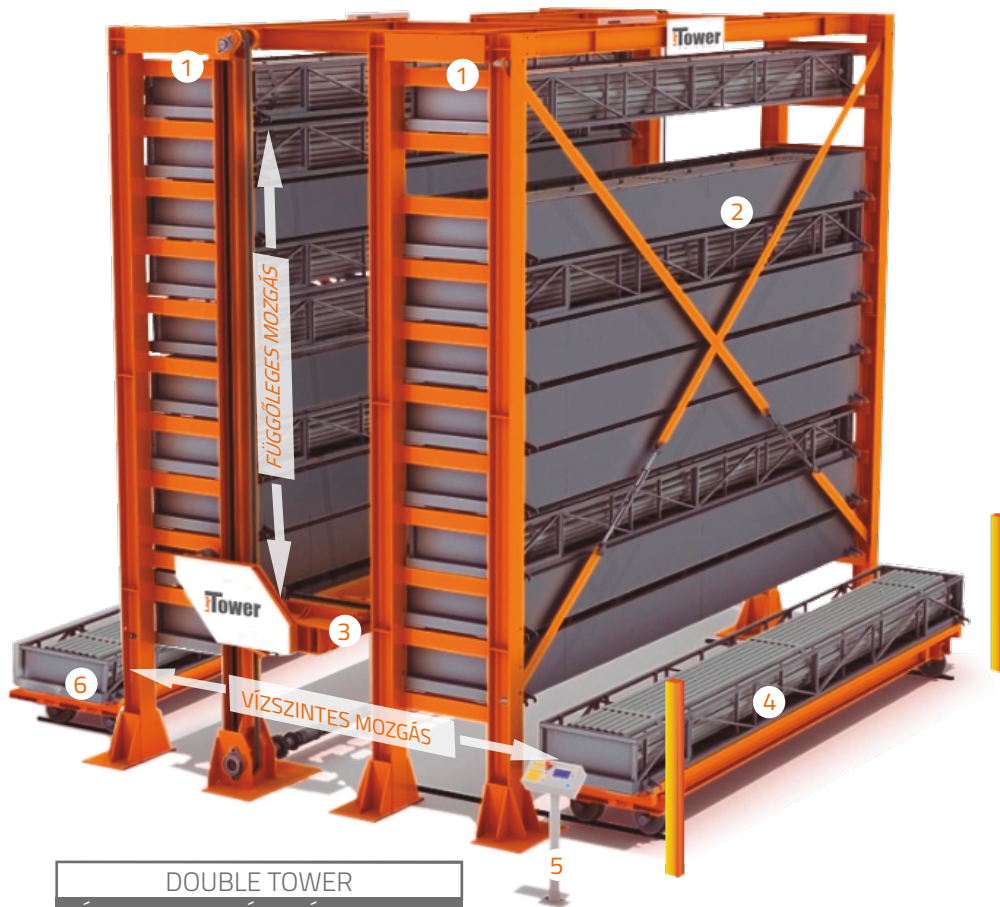
DOUBLE TOWER KÉT TORNYS TÁROLÓ RENDSZER