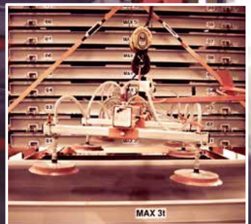
DARUS, ÉS VÁKUMOS LIFT KISZOLGÁLÁS