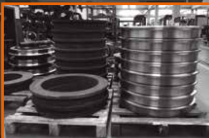
EGYÉB RENDHAGYÓ TERMÉKEK