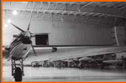
NAGY MÉRETŰ TERMÉKEK