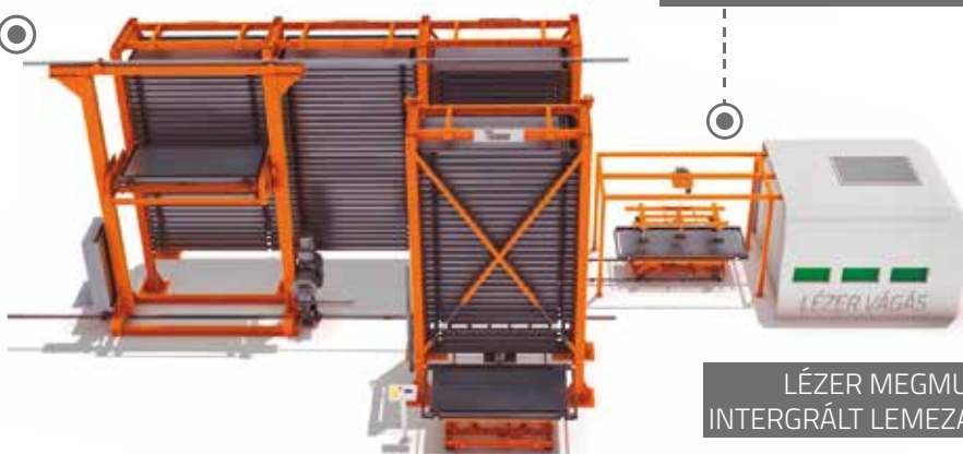
LÉZER MEGMUNKÁLÓ ÁLLOMÁSBÁ INTERGRÁLT LEMEZANYAG TÁROLÓ RENDSZER