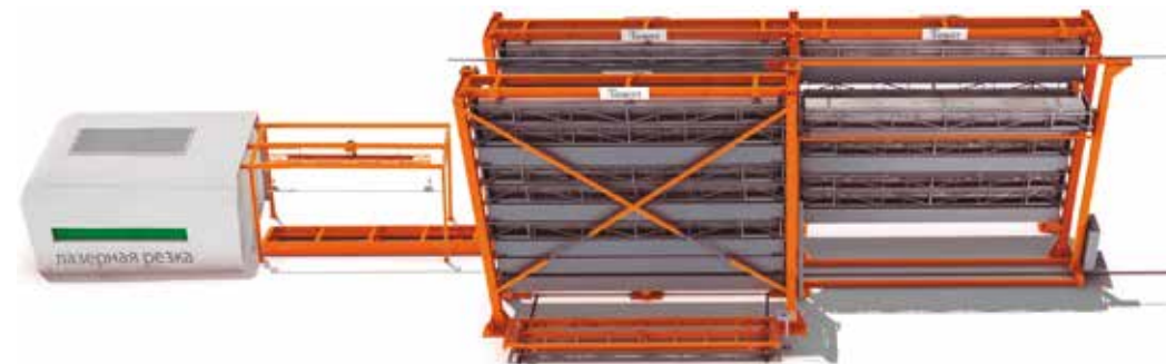
MULTI LOGITOWER склад интегрированный с системой резки долгомеров