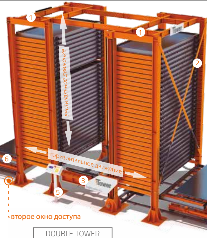
DOUBLE TOWER двубашенный склад