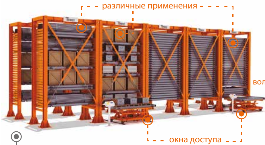
MULTI LOGITOWER многобашенный склад