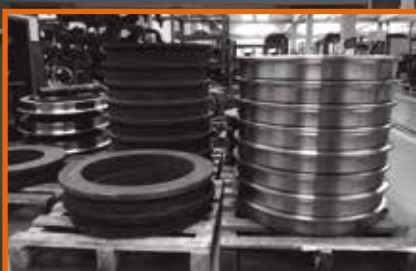
другие нестандартные применения