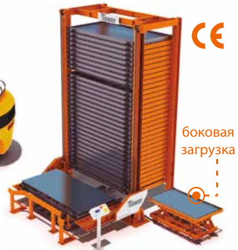
SINGLE TOWER однобашенный склад