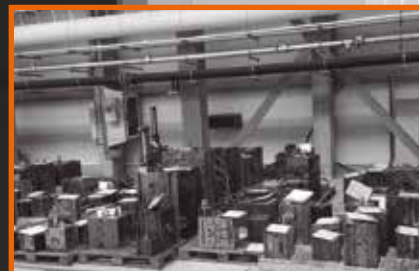
тяжелые инструменты/ пресс-формы