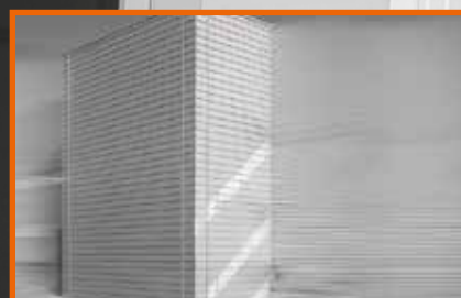
установка снаружи здания