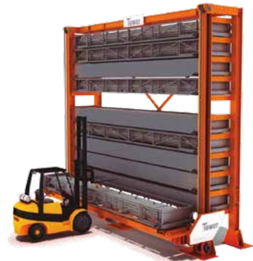
SINGLE TOWER однобашенный склад