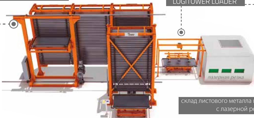
склад листового металла интегрированный с лазерной резкой

Logi TowerLoader АВТОМАТИЧЕСКАЯ ЗАГРУЗКА LOGITOWER LOADER