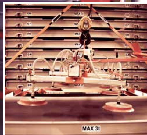
обслуживание кран-балкой или вакуумным захватом